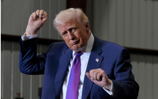
Фото: Дональд Трамп (Getty Images)

Обирайте перевірене - додайте РБК-Україна до улюблених джерел у Google