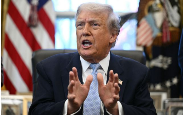
Фото: президент США Дональд Трамп

Обирайте перевірене - додайте РБК-Україна до улюблених джерел у Google