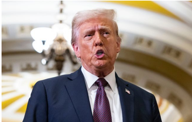
Фото: Дональд Трамп (Getty Images)

Обирайте перевірене - додайте РБК-Україна до улюблених джерел у Google