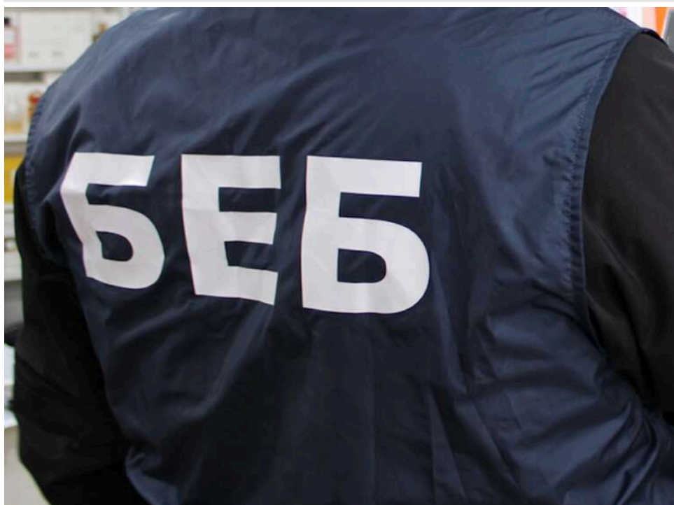
БЕБ викрило схему ухилення від антидемпінгових мит на 9,8 мільйона гривень через фальсифікацію походження товарів

В Україні викрили схему ухилення від антидемпінгового мита, яка завдала державі збитків на 9,8 млн грн. Її суть полягала у фальсифікації країни походження товару, що давало змогу уникати сплати мит і ПДВ.