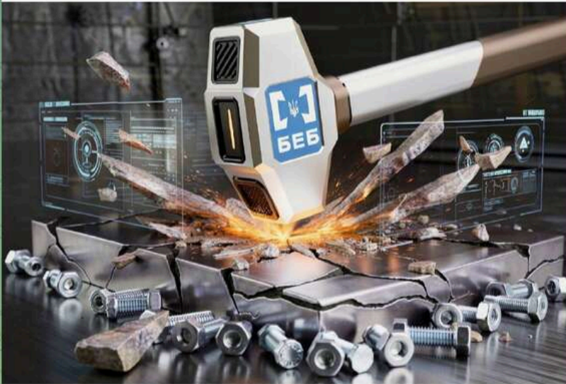
Схема на 9,8 млн грн, після якої держава змінила правила гри БЕБ не просто викрив ухилення від сплати антидемпінгового мита - ми закрили сам механізм.

Під час досудового розслідування встановили, що керівниця підприємства організувала незаконний імпорт металевих виробів за підробленими документами. Збитки державному бюджету перевищили 9,8 млн грн. Їй уже повідомили про підозру.