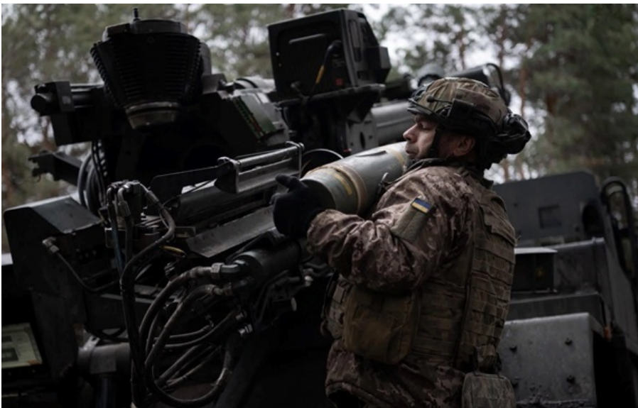
Украина в феврале достигла удивительных территориальных успехов

Украина достигла значительных территориальных успехов, а Россия испытывает сильное давление из-за санкций и войны - больше, чем сообщается в СМИ.