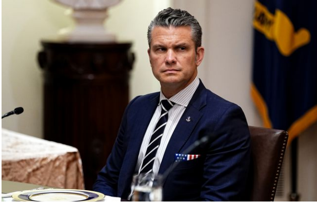
Фото: глава Пентагону Піт Хегсет

Обирайте перевірене - додайте РБК-Україна до улюблених джерел у Google