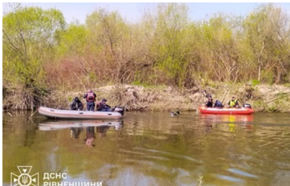
На Рівненщині у річці знайшли тіло зниклого хлопчика

Десять днів тому, 5 квітня, було знайдено тіло його молодшого брата, після чого всі зусилля були спрямовані на розшук старшої дитини.