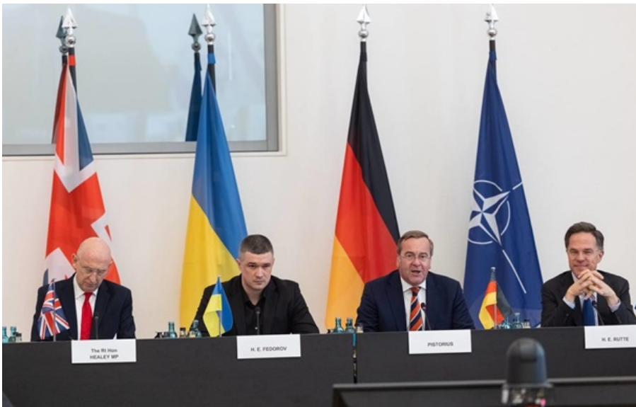
Учасники 34 засідання у форматі Рамштайн

ЗСУ на полі бою не лише утримують позиції, але і нарощують тиск. А втрати Росії досягли рівня, що перевищує темпи її мобілізації.