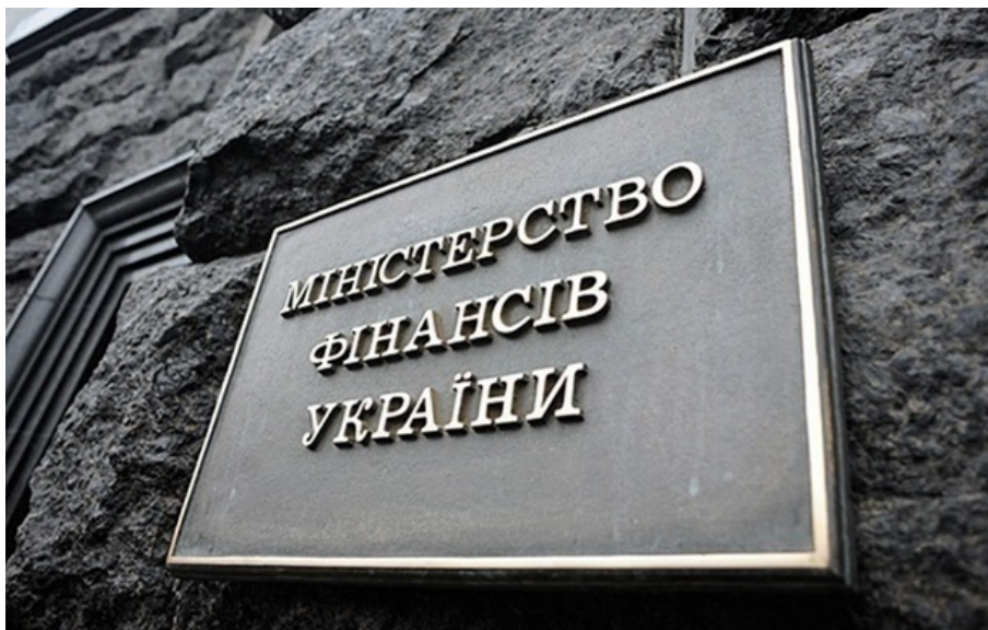
Мінфін розмістив ОВДП на 2,8 мільярда

Із початку 2026 року держава вже залучила понад 123,3 млрд грн, а з початку повномасштабної війни - понад 2,2 трлн грн.