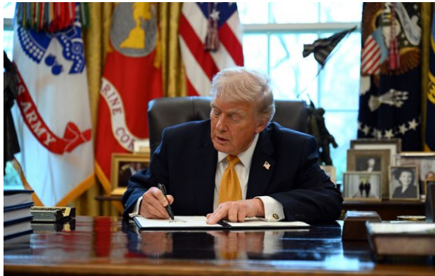
Фото: Дональд Трамп (Getty Images)

Обирайте перевірене - додайте РБК-Україна до улюблених джерел у Google