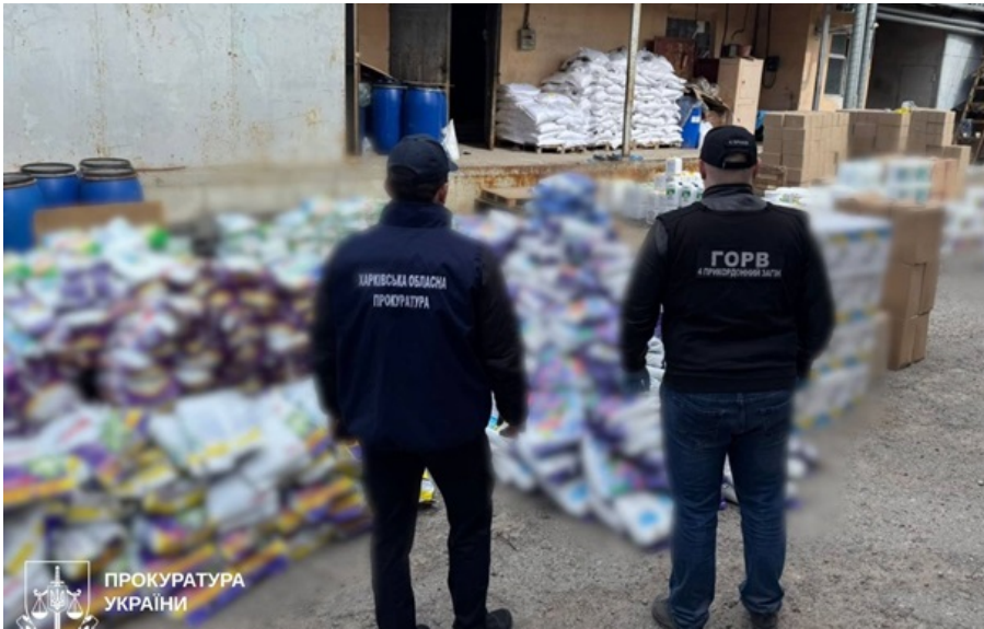
У Харкові викрили підпільний завод підробок світових брендів побутової хімії

За попередніми оцінками, організатори цієї схеми отримували щомісяця дохід близько п'яти мільйонів гривень.