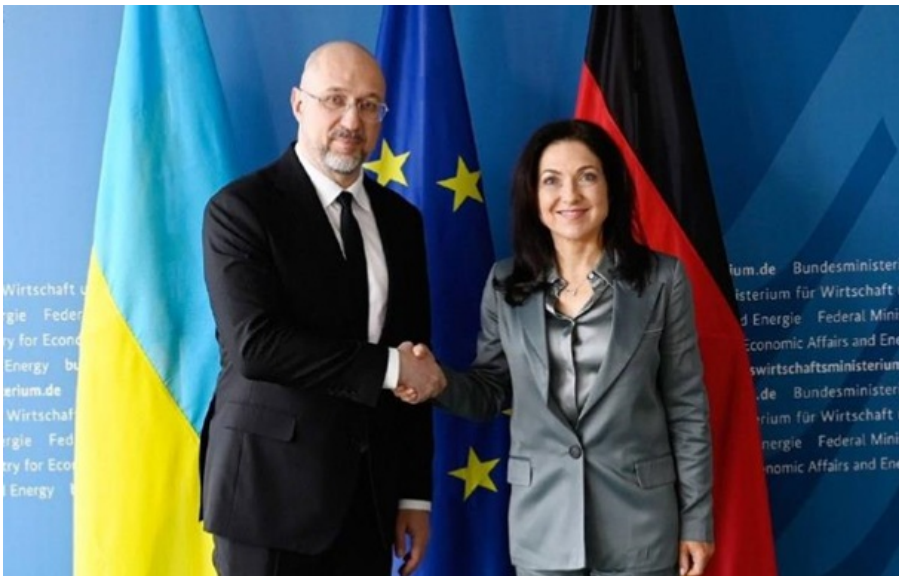
Шмигаль з федеральною міністеркою економіки та енергетики Німеччини Катериною Райхе

Раніше Шмигаль запропонував Німеччині створити спільний механізм формування стратегічного резерву енергетичного обладнання для України за участі Німеччини та інших партнерів.