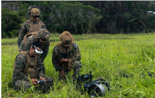
Фото: морпіхи армії США (Корпус морської піхоти США)

Обирайте перевірене - додайте РБК-Україна до улюблених джерел у Google