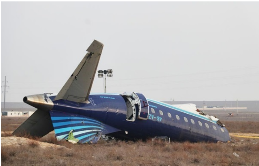
Місце падіння літака AZAL