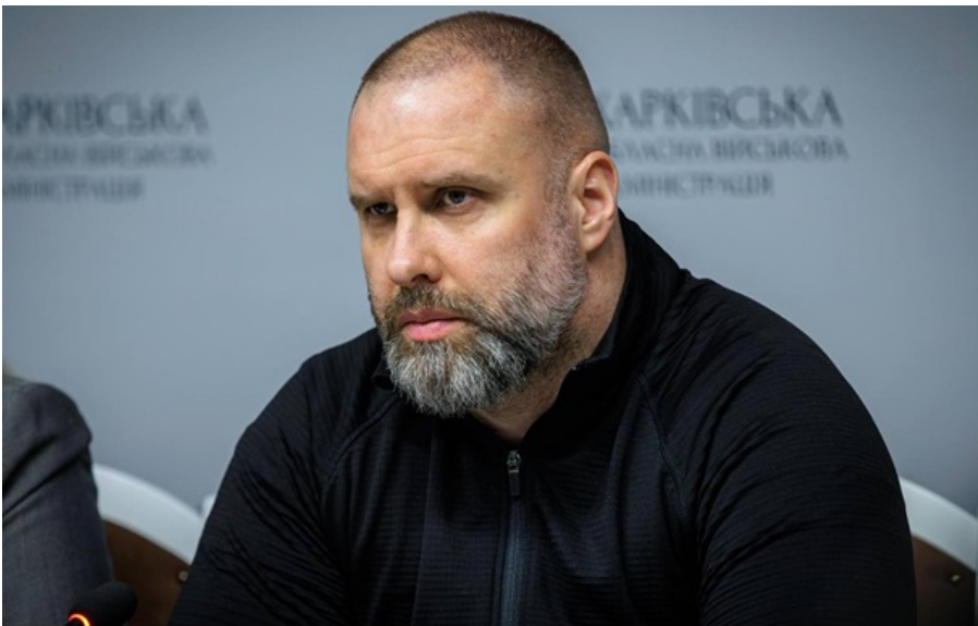
Олег Синегубов повідомив про результати засідання Ради оборони області

На Харківщині розширили зону примусової евакуації, зокрема для родин із дітьми у низці населених пунктів Шевченківської та Великобурлуцької громад.