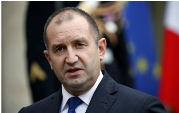
Румен Радев

Сьогодні, 19 квітня, в Болгарії відбудуться парламентські вибори. На них великі шанси перемогти має проросійський експрезидент Румен Радев.