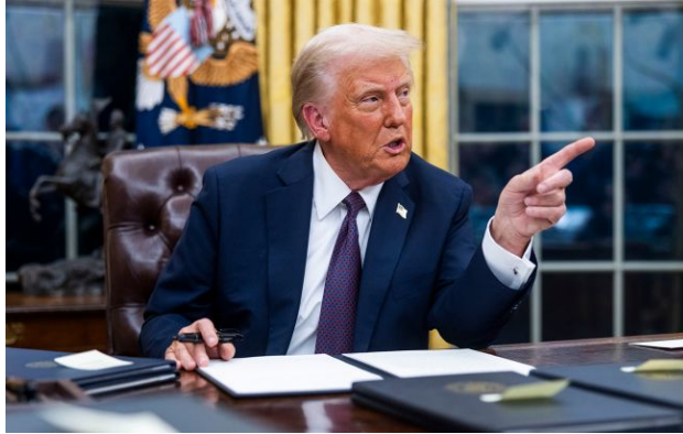
Фото: президент США Дональд Трамп

Обирайте перевірене - додайте РБК-Україна до улюблених джерел у Google