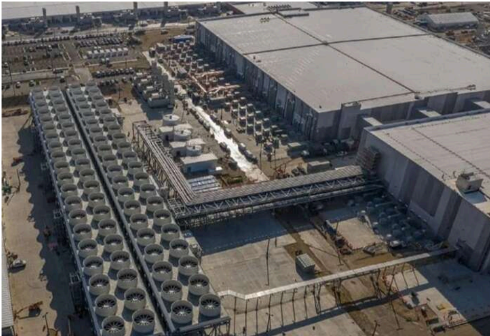
У США почали обмежувати датацентри: штат Мен запровадив заборону

У США посилюється опір датацентрам: штат Мен запровадив заборону на їх будівництво – FT.