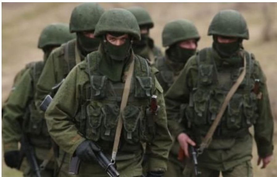
У квітні ворог окупував на 11.9% менше території, ніж у березні

Росіянам треба провести 36 штурмових дій, аби просунулися на території в один квадратний кілометр.