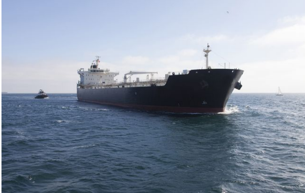
Фото: США перенаправили понад 40 суден, які хотіли прорватися через блокаду (Getty Images)

Обирайте перевірене - додайте РБК-Україна до улюблених джерел у Google