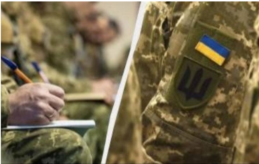
У ЗСУ запустили консультативну раду з іноземними військовими експертами

Рада допомагатиме впроваджувати інституційні зміни в системі управління ЗСУ, підтримувати трансформацію армії та підвищувати її ефективність.