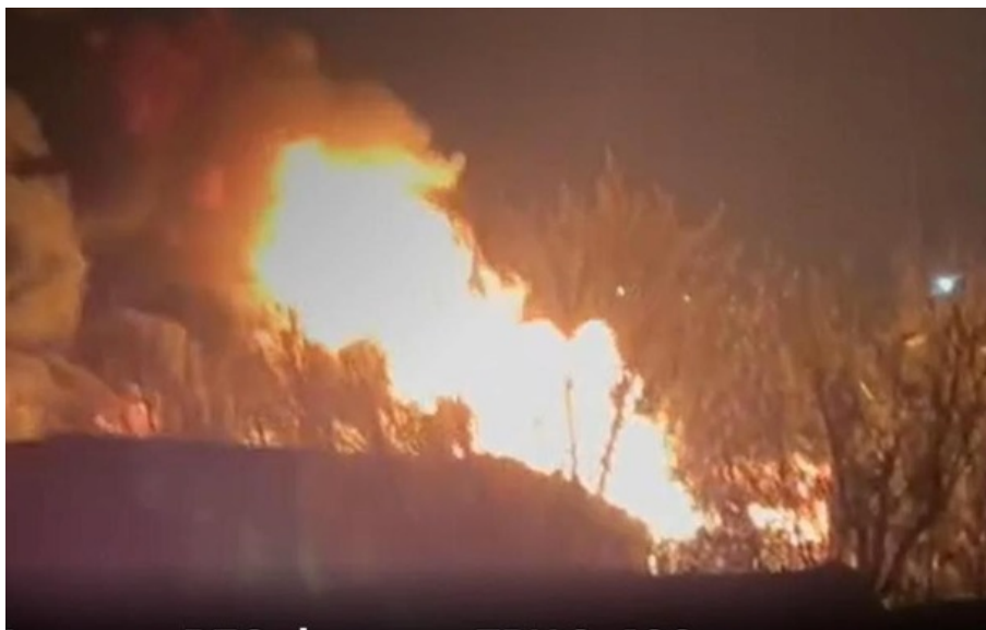
Наслідки одного з "прильотів"

Під удари потрапили РЛС зі складу ЗРК С-400, логістичні об'єкти та зосередження живої сили противника.