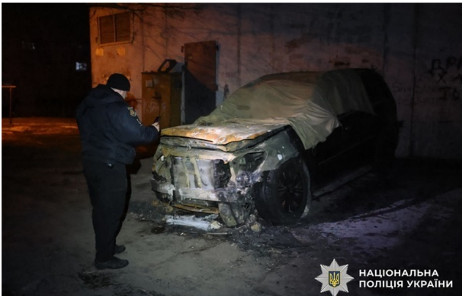
Фото: Нацполіція (ілюстративне фото) Російські агенти вчиняли підпали у Дніпрі та в Одесі

Обом місцевим жителям повідомлено про підозру. Їм загрожує довічне позбавлення волі з конфіскацією майна.