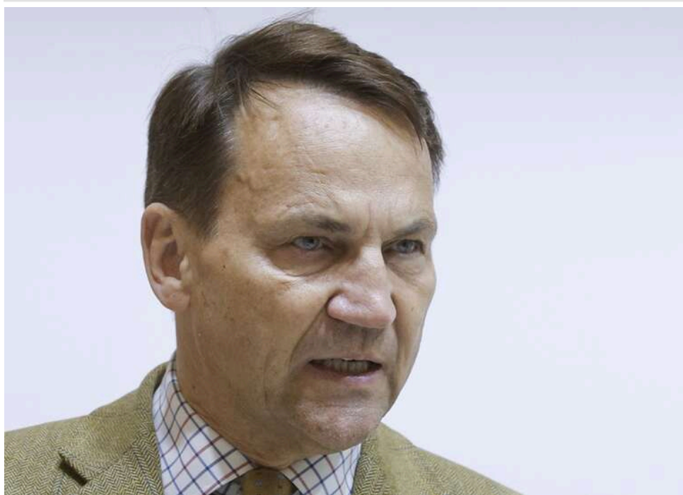
Внесок у 100 мільярдів злотих: Сікорський заявив про рекордний вплив українців на економіку Польщі

Українці, що проживають у Польщі, стали важливою частиною економіки країни. Про це заявив міністр закордонних справ Польщі Радослав Сікорський, представляючи завдання польської дипломатії в парламенті.