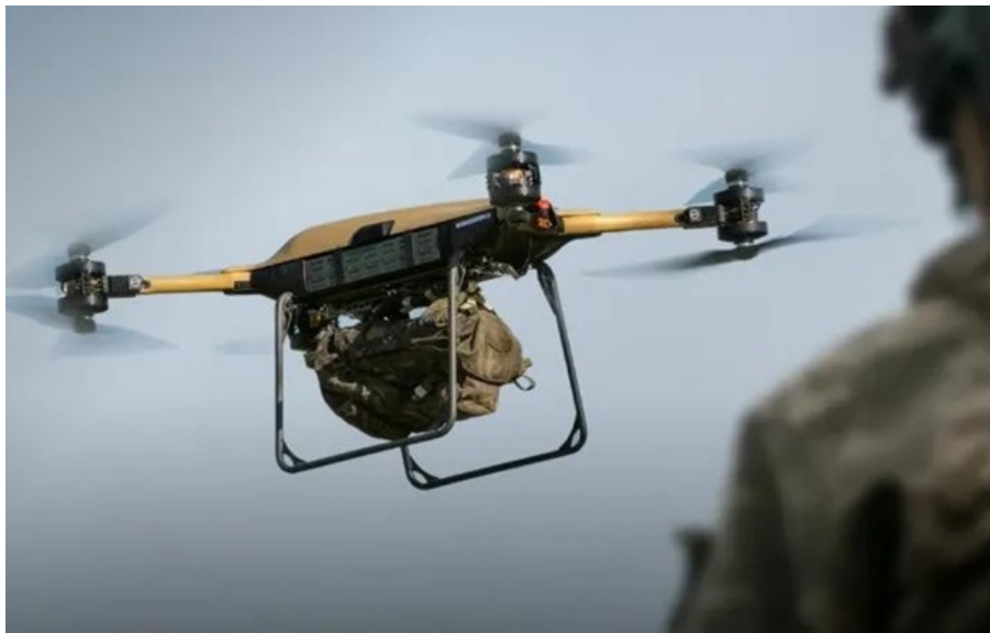
Malloy T-150 в умовах сучасної війни стали і надійним інструментом підтримки, і засобом виконання точкових бойових завдань

БПЛА доставили вибухівку, завдяки якій вдалось суттєво пошкодити опори моста, щоб потім остаточно знищити його.