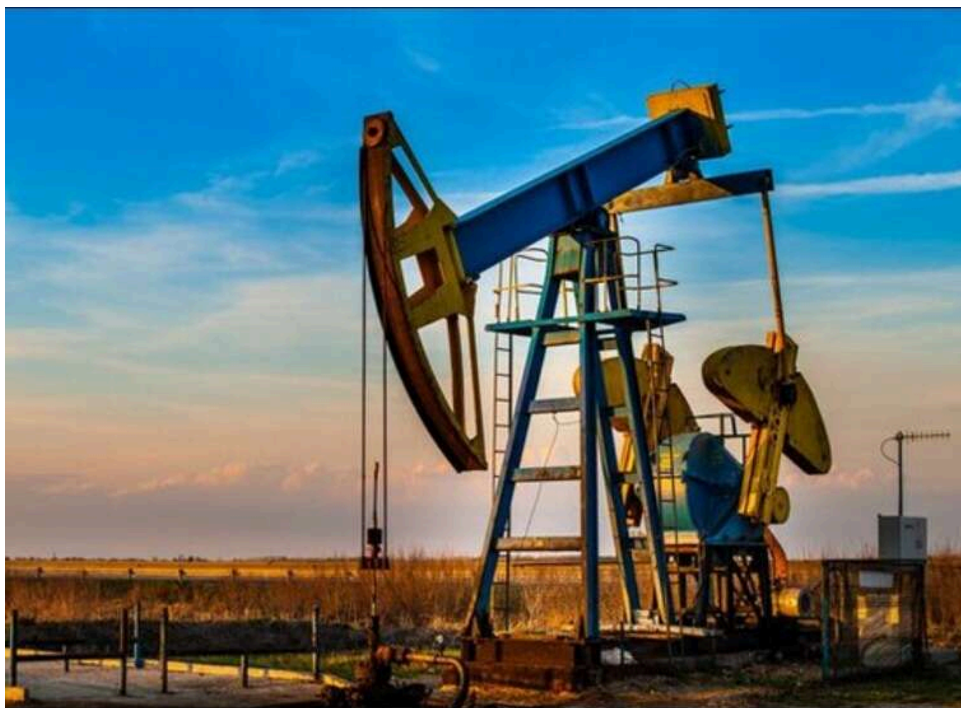
Іран може скоротити видобуток нафти через санкційний тиск США, – FT

Іран може скоротити видобуток нафти через 16 днів на тлі санкційного тиску США – FT.