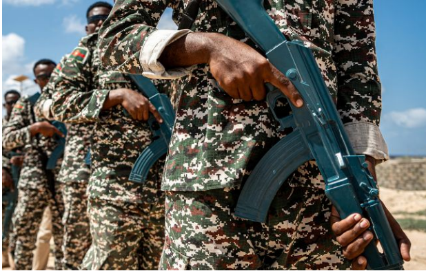
Фото: понад 5 тисяч іноземців загинули в лавах армії РФ

Обирайте перевірене - додайте РБК-Україна до улюблених джерел у Google