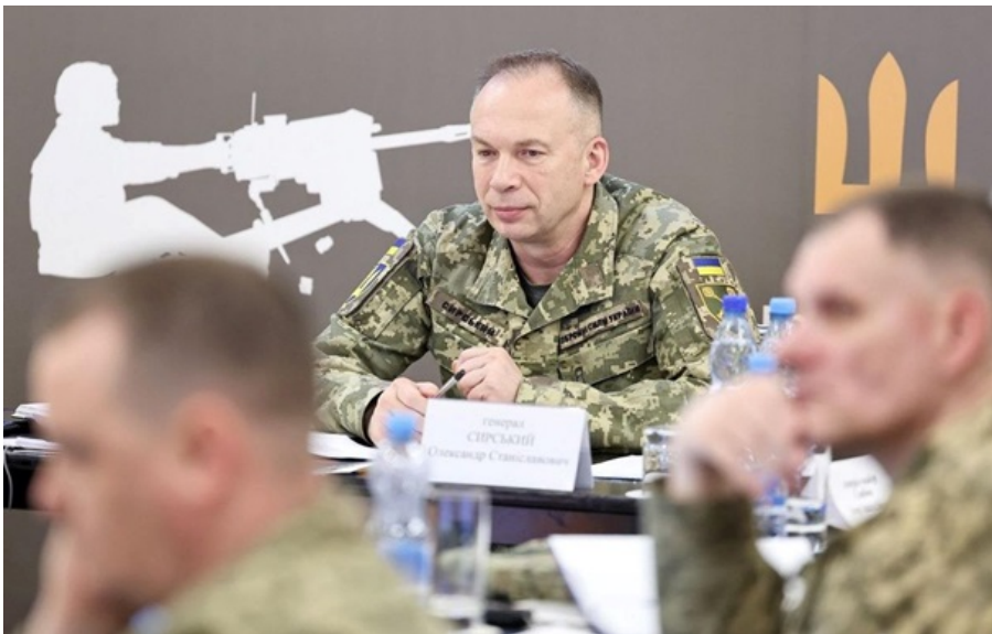
Олександр Сирський провів нараду за підсумками боїв у березні

Російській кількості протиставляється українська якість ведення бойових дій, зазначив головком.