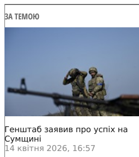
Генштаб заявив про успіх на Сумщині 14 квітня 2026, 16:57