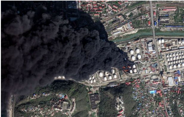
Фото: Сили оборони атакували НПЗ у Туапсе чотири рази за два тижні (Getty Images)

Обирайте перевірене - додайте РБК-Україна до улюблених джерел у Google