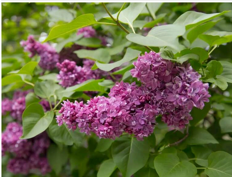
До 1 360 гривень за букет: юристи нагадали про штрафи за ламання бузку в громадських місцях

З настанням травня українські міста і села буквально потопують у цвітінні бузку. Пишні кущі з ніжно-фіолетовими, білими та рожевими суцвіттями не лише прикрашають вулиці, а й наповнюють повітря характерним солодким ароматом.