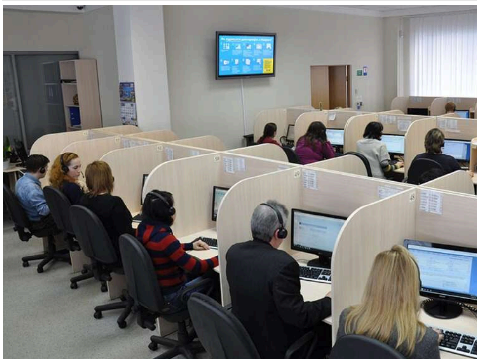
Схема на 100 мільйонів: як підставні фірми роками «освоюють» бюджет на гарячій лінії «15-45»