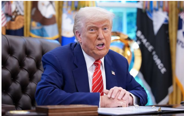
Фото: Дональд Трамп, президент США (Getty Images)

Обирайте перевірене - додайте РБК-Україна до улюблених джерел у Google