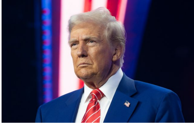
Фото: президент США Дональд Трамп (Getty Images)

Обирайте перевірене - додайте РБК-Україна до улюблених джерел у Google