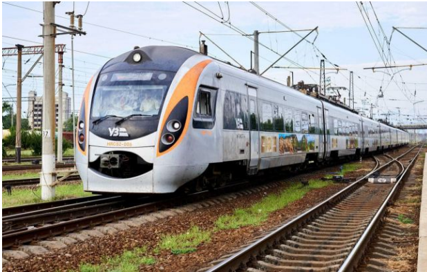
Фото: поїзд (facebook.com Ukrzaliznytsia)

Обирайте перевірене - додайте РБК-Україна до улюблених джерел у Google