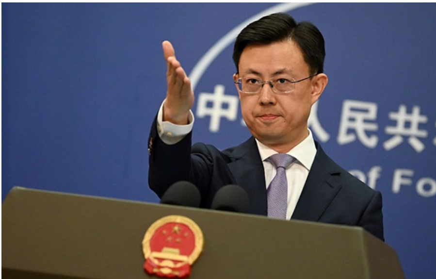
Речник МЗС Китаю Лінь Цзянь

Пекін наполягає, що інформація медіа про нібито військову допомогу Ірану з боку Китаю є "повністю сфабрикованою".