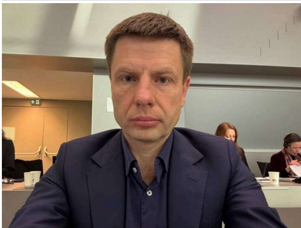
Веселий, Цукерман та «свої» кандидати: нардеп Гончаренко опублікував записи про тіньові призначення у держбанку

Народний депутат Гончаренко опублікував розширену версію «плівок Міндіча», пов'язаних з призначеннями в Sense Bank та зривом угоди щодо постачання бронешилетів.