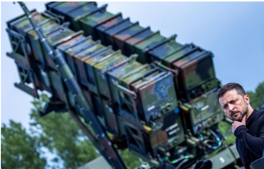
Володимир Зеленський біля пускової установки Patriot в Німеччині

Президент висловив незадоволення негативним впливом війни з Іраном на мирні зусилля та постачання зброї для України.