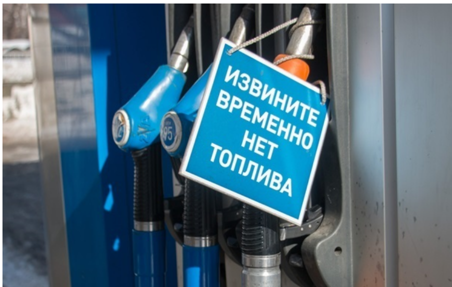
Фото: Російські ЗМІ (ілюстративне фото)

Росіянам доводиться купувати пальне у перекупників по 30–35 тисяч рублів за бочку в 200 літрів.