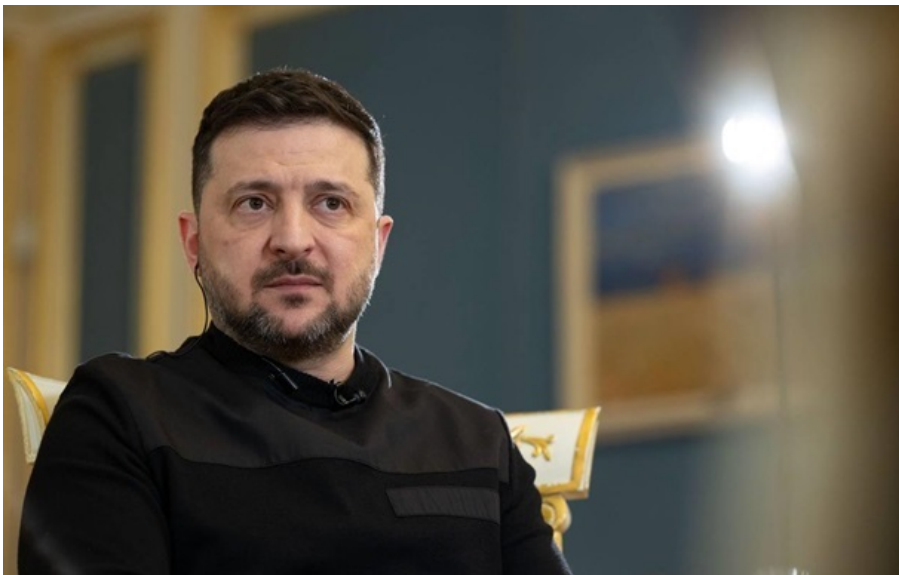
Зеленський розповів про посилення захисту в Дніпрі та Одесі

Росіяни намагаються тепер обійти українську ППО щільністю нападу та інтенсивністю ударів, зауважив президент.