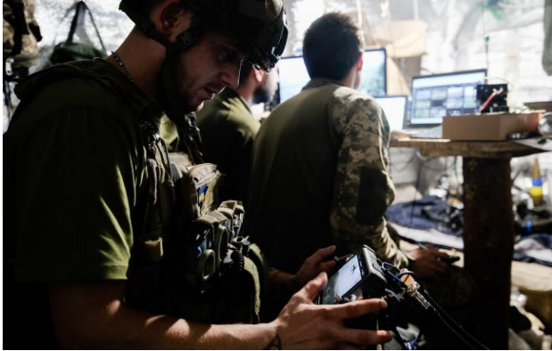
Фото: українські дрони дісталися до глибокого тилу РФ

Обирайте перевірене - додайте РБК-Україна до улюблених джерел у Google