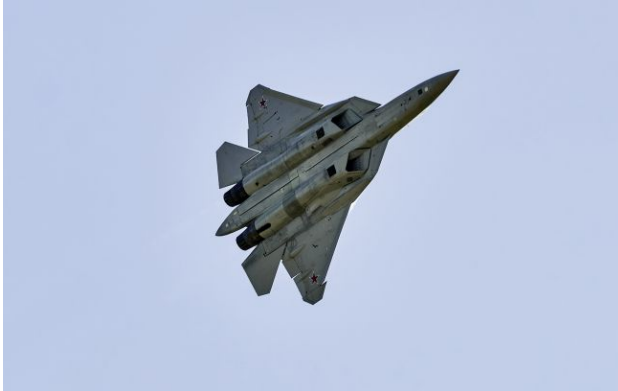
Фото: російський Су-57

Обирайте перевірене - додайте РБК-Україна до улюблених джерел у Google