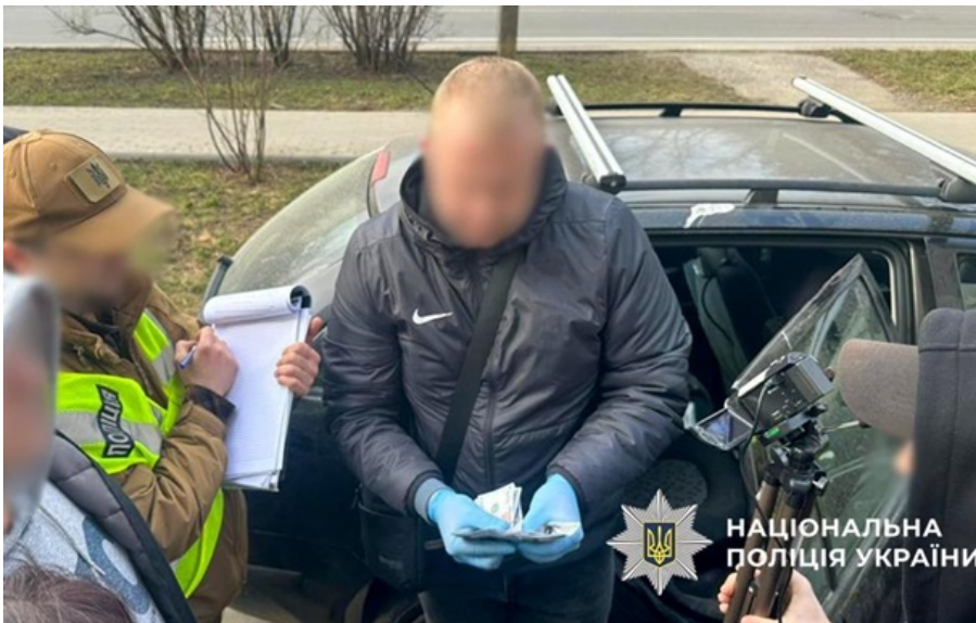
Поліція затримала зловмисників, які пропонували за гроші "вирішити питання" з мобілізацією

У Києві зловмисники пропонували посади з "бронєю", а на Хмельниччині - обіцяли швидке зняття з розшуку.