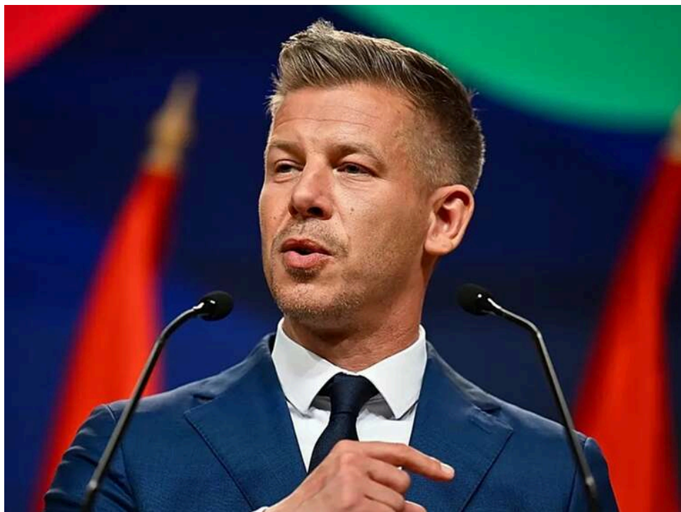
Кінець "фабрики брехні": Петер Мадяр анонсував негайну зупинку державних ЗМІ

Майбутній прем'єр-міністр Угорщини Петер Мадяр заявив, що припинить мовлення державних ЗМІ та підготує реформу медіа, яка забезпечить свободу преси в країні.