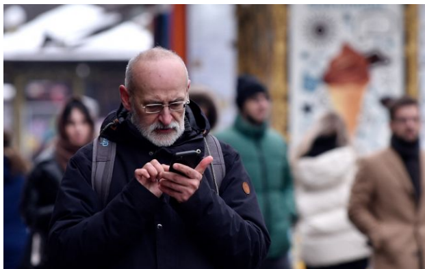
Фото: оператори мобільного зв'язку мають змінити рекламу безлімітного інтернету

Обирайте перевірене - додайте РБК-Україна до улюблених джерел у Google