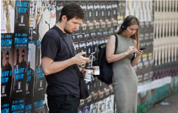
Фото: оператори мобільного зв'язку мають змінити рекламу безлімітного інтернету

Обирайте перевірене - додайте РБК-Україна до улюблених джерел у Google