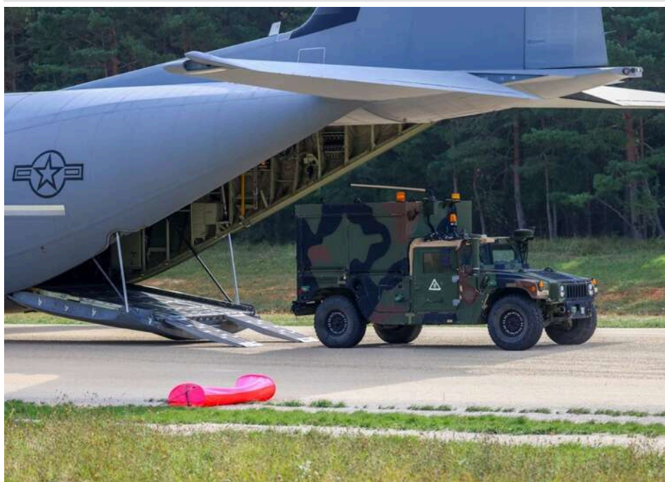
США закликають Європу активніше купувати американську зброю для завершення війни в Україні, – Колбі

США закликають Європу до більш активних закупівель американської зброї для завершення війни в Україні.