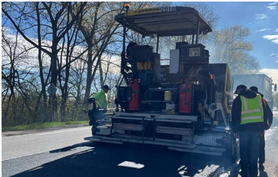
Ремонт покриття на міжнародних трасах

У фокусі - ключові логістичні маршрути та міжнародні коридори, якими рухається допомога, забезпечується робота бізнесу та зв'язок між регіонами.