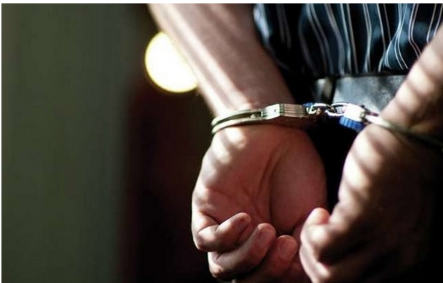
Фото: Київська міська прокуратура (ілюстративне фото) Підприємець із Вінниці обвинувачується у зґвалтуванні 12-річної

Чоловіку загрожує покарання у виді позбавлення волі на 15 років або довічне позбавлення волі.