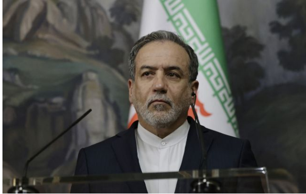
Фото: міністр закордонних справ Ірану Сейєд Аббас Аракчі

Обирайте перевірене - додайте РБК-Україна до улюблених джерел у Google