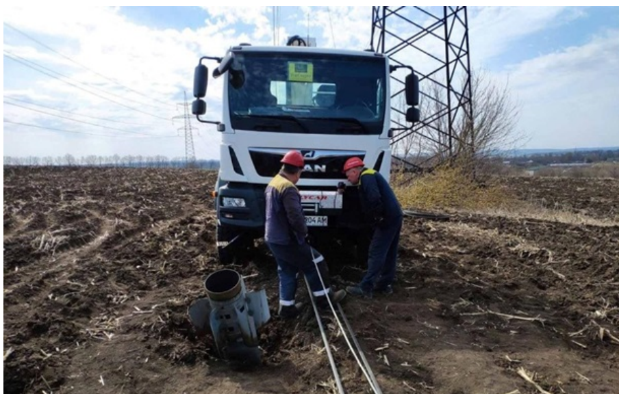
В енергетиків додалося роботи після сьогоднішньої ночі

Аварійно-відновлювальні роботи вже розпочаті там, де це наразі дозволяють безпекові умови.