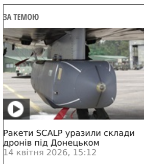
ЗА ТЕМОЮ Ракети SCALP уразили склади дронів під Донецьком 14 квітня 2026, 15:12